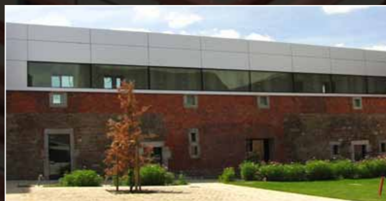
Golf Naxhelet Wanze: natuurkleurig geanodiseerde platen realisatie Dejeond-Delarge Luik