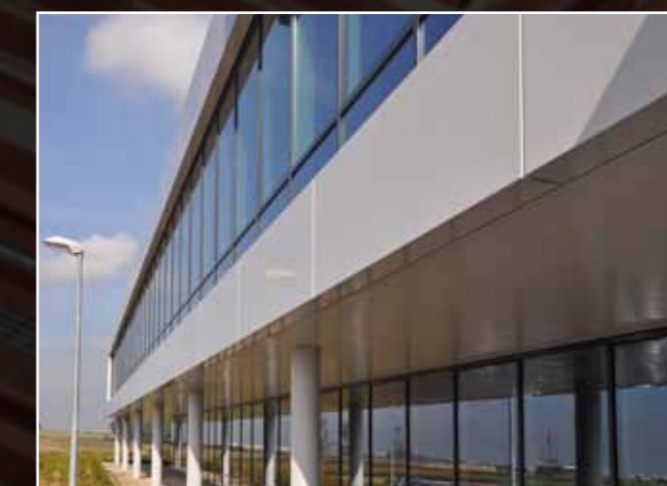
Arval Brussel, cassettegevel uit gelakt aluminium, Ursus Eeklo