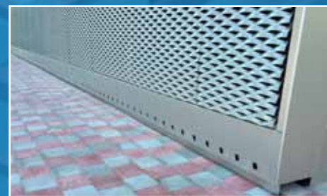
realisatie HD Systems Verviers