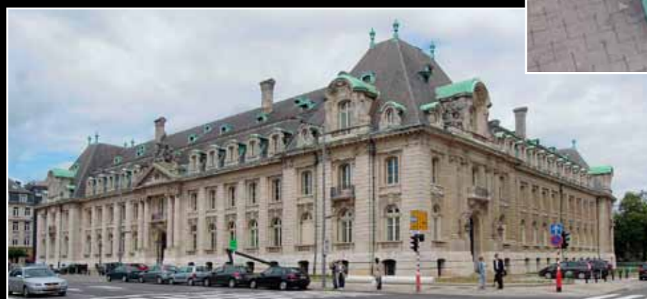
Arcelor Mittal Luxembourg, Tecu-Patina, Dinanderie Clabots Dinant