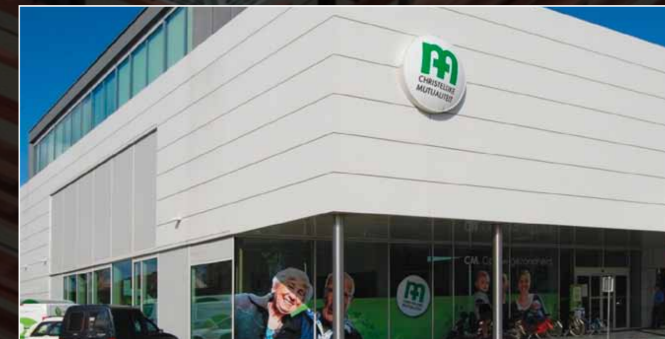
CM Hasselt, cassettegevel uit gelakt aluminium, Sign&Facade Molenstede

soort Standaard = EN-AW 3105 H22 ; EN-AW 5005 H14/H24 ; EN-AW 1050 H14/H24 Andere kwaliteiten of andere hardheden op aanvraag lakken Poederlak met verschillende glansgraden 80 % of 30 % kleur Standaard : belgisch wit ; grijsbruin ; blank aluminiumkleurig ; licht ivoorkleurig ; antracietgrijs ; gitzwart ; zuiver wit ; leigrijs ; ombergrijs Andere kleuren op aanvraag afmetingen Standaard : 0,8 à 2 mm dikte 1000-1250-1500 mm breed ; 2000-2500-3000 mm lang Andere afmetingen op aanvraag