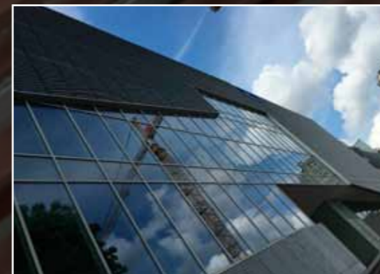
Phenix 5 Charleroi

soort AIMg1 EN-AW 5005 H14/H24 10 of 15 Mu Standaard = naturel , champagne, goud, zwart, brons of andere kleuren op aanvraag afmetingen Standaard : 0,5 à 4 mm dikte ; 1000-1250-1500 mm breed ; 2000-2500-3000-4000 mm lang, Andere afmetingen op aanvraag bescherming folie 80Mu, Laserfolie, Fiberfolie, Easy Peel Met of zonder tussenpapier