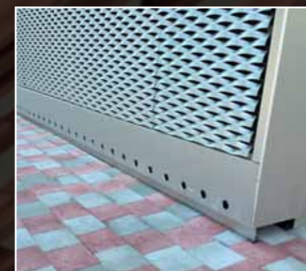
Phenix 5 Charleroi, cinemacomplex met brasserie: geperforeerde plinten en afwerking in geanodiseerd aluminium rond een gevelbekleding in strekmetaal. HD Systems Verviers