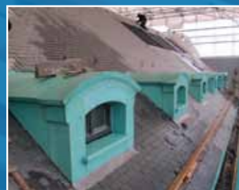
realisatie Dinanderie Clabots Dinant