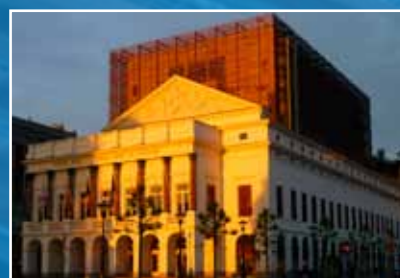
realisatie Dejeond-Delarge Luik