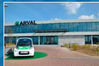
realisatie Ursus Eeklo

In gevelbekleding is de combinatie van prestatie en esthetiek in de voorbije jaren cruciaal geworden. Of het nu over een nieuwe constructie dan wel over de make-over van een bestaande constructie gaat, elk gevelproject heeft specifieke eisen !